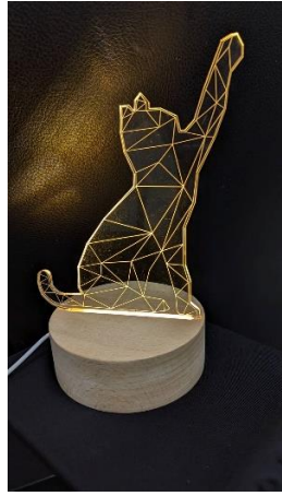
(雷射光雕小夜燈樣本)