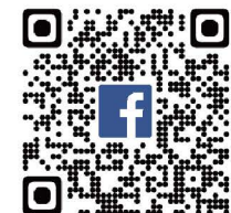
臺北市職探體驗中心