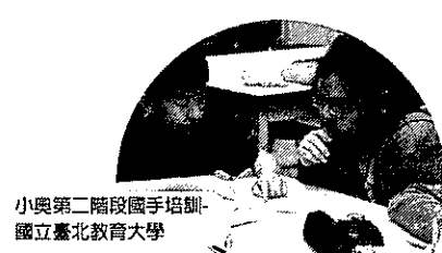
小奧第二階段國手培訓-國立臺北教育大學