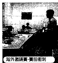
海外邀請賽-賽前衝刺