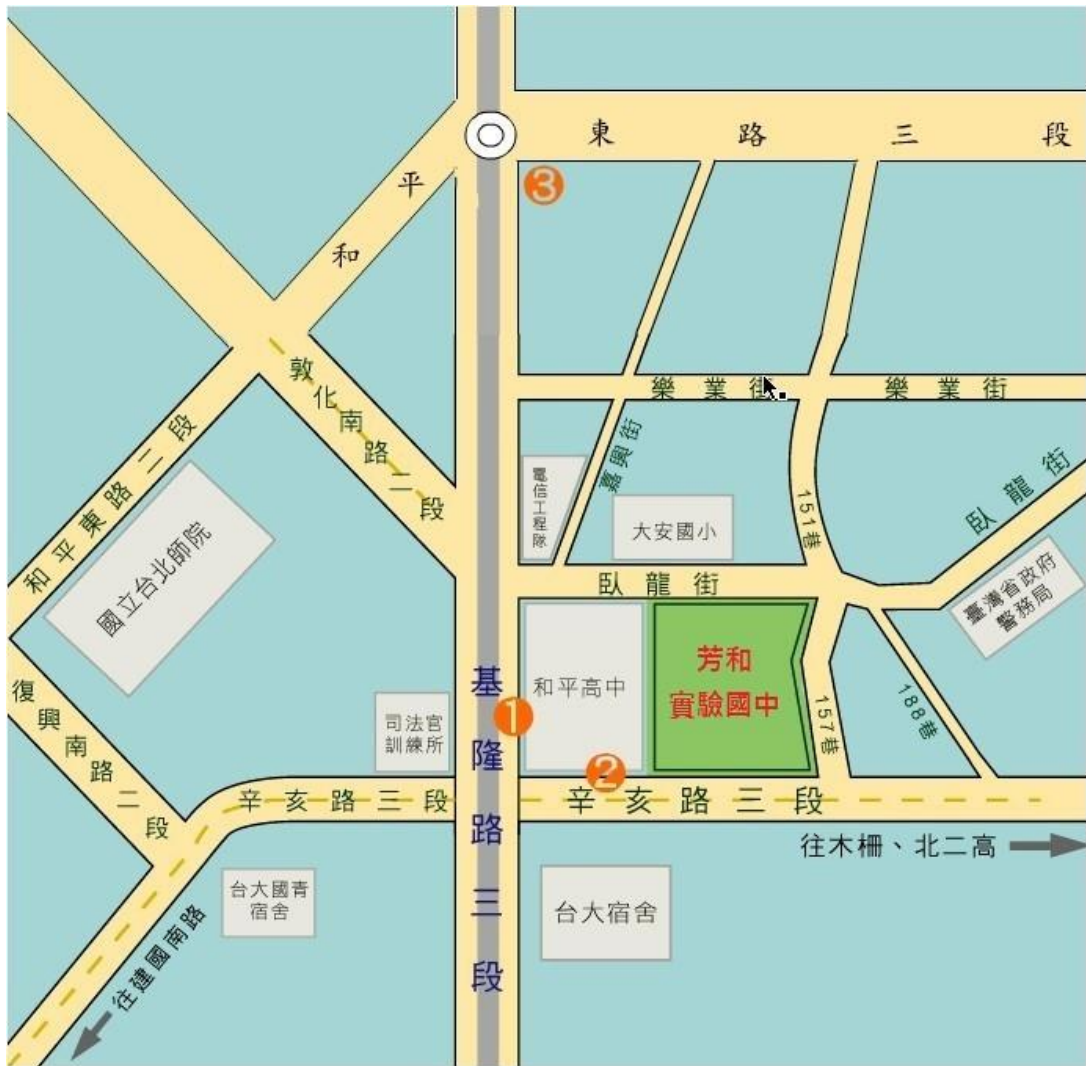
(四)芳和實中交通位置圖