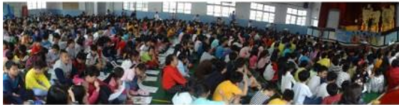
「一心戲劇團」劇中戲團團照(左)

天哪！「七夕情人踭」瞬間燃爆了呀！！ 這個姑娘到底是谁？惹煞惹煞、千萬別惹惱喜喜！打破暗紅的織女怒氣沖沖，如何喜喜甘休？玉容織女又將如何平息這樁家庭糾紛？請看我們精心為莘莘學子們打造的精彩好戲《七夕情人誰來踭?》示範演出。