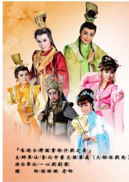
『喜遊台灣國寶歌仔戲之美』 主辦單位/臺北市藝文推廣處(大稻埕戲苑) 演出單位/一心戲劇團 導演 師/孫詩琳 老師