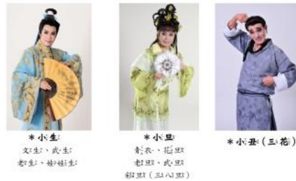
*小生: 文生、武生、老生、梅蘭芳 *小姐: 彩衣、花旦、彩旦、武旦 *小丑(三花): 彩旦(三花旦)

草根性深厚的歌仔戲由「三小戲」為基礎發展而來，由「小生、小姐、小丑(三花)」三類角色扮演，而其表現方式是融合了「歌」<音樂歌唱>、「舞」<戲曲身段>、「戲」<故事情節>三者來傳達思辨理念，也就是演員透過「唱、做、打」之體現，所形成的「有聲有戲、無聲不舞」的表演藝術。傳統戲曲是一種「虛擬象徵」呈現方式，加入超越現實侷限「寓意」觀點，將表演藝術更推向深層的美學境界，這也是中國戲曲之所異於西方戲劇最重要的美學特色。