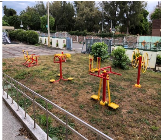
宿舍外有籃球場及遊樂設施