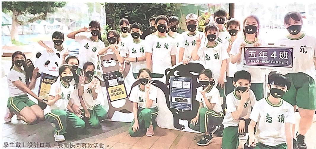
學生戴上設計口罩，展開快閃募款活動。