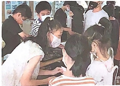
▲全校小朋友響應活動，排隊預購口罩。

五年級國語課文介紹世界各地用不同方式慶祝兒童節，最後引導思考「不是世界上所有國家的兒童，都能擁有歡慶的氣氛呢？」一個學生說：「烏克蘭的小朋友就不行。」 他們正在逃難……」近日媒體不斷播送國際戰爭新聞，把戰爭的無情深烙在孩子心中。 「同樣是兒童，我們可以為烏克蘭小朋友做些什麼？」探討這個問題，也開啟了學生跨國界的關懷兒童行動。 問題探究 發展行動 「烏克蘭兒童面臨什麼困境？」學生人手一平板，上網搜