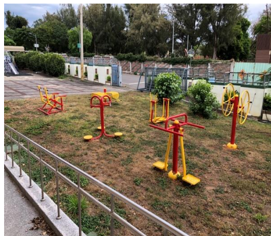
宿舍外有籃球場及遊樂設施