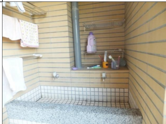
寢室設有洗衣台及曬衣空間