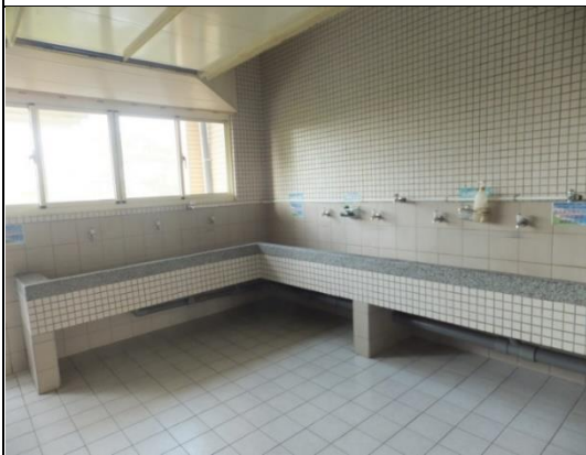
公共區設有洗衣空間和脫水機