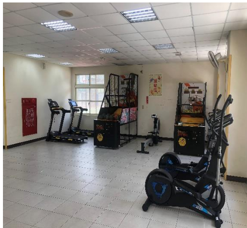
一樓設有籃球機、健身器材