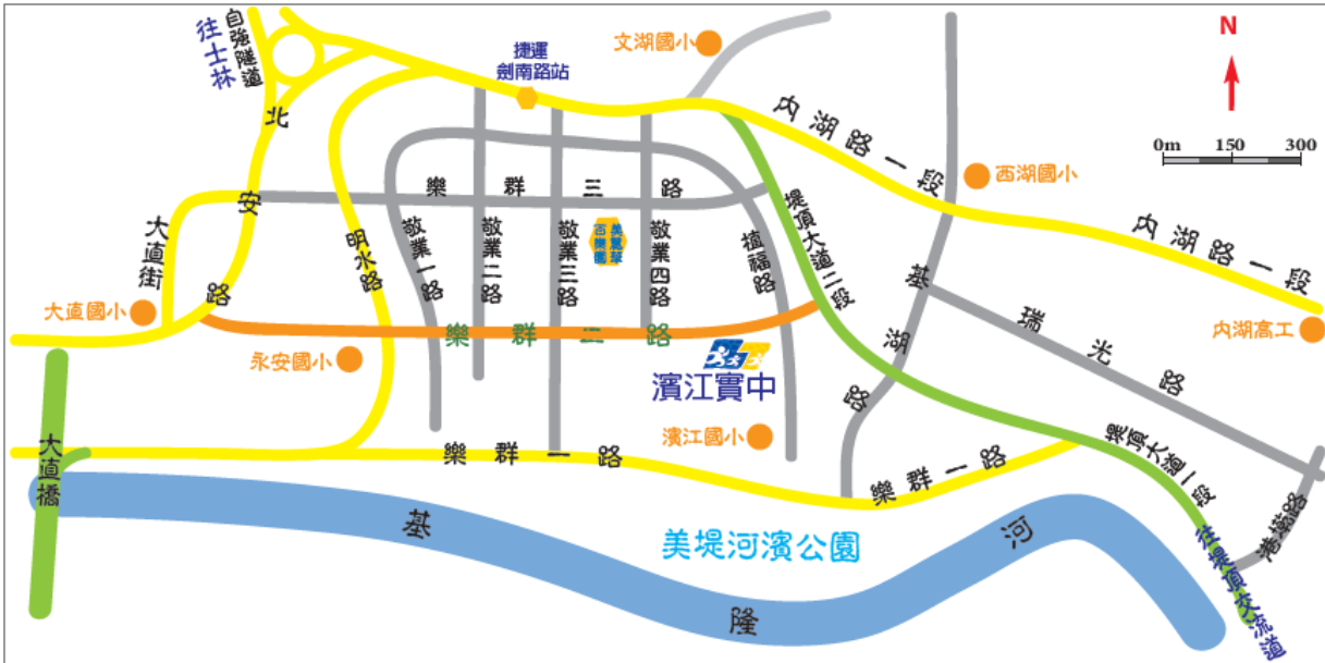
(四)濱江實中交通位置圖